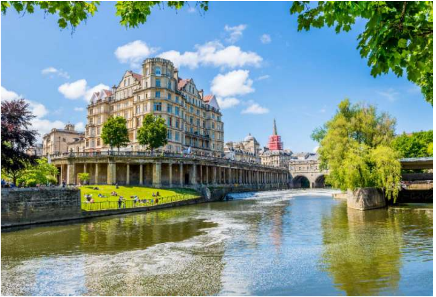
วันที่หก เมืองบาร - มหาวิหารบาร - โรงอาบน้ำโรมันโบราณ - เมืองซาลิสบิวรี - อนุสาวรีย์เสาคินสโตนเฮนจ์ - เมืองลอนดอน (B/-/D)

เช้า บริการอาหารเช้า ณ ห้องอาหารของโรงแรม นำท่าน ถ่ายรูปเป็นที่ระลึก กับ มหาวิหารบาร (Bath Abbey) และ บริเวณด้านหน้าของ โรงอาบน้ำโรมันโบราณ (Roman Baths) ถือเป็นโรงอาบน้ำโรมันขนาดใหญ่ในสมัยโบราณที่ได้รับการอนุรักษ์และดูแลเป็นอย่างดี ซึ่งโรงอาบน้ำของที่นี่อยู่ต่ำกว่าระดับพื้นถนนในปัจจุบัน ภายในแบ่งออกเป็นโซนหลักๆ 4 โซนด้วยกัน ตั้งแต่โซน Sacred Spring, Roman Temple, Roman Bath House และ Museum ซึ่งแหล่งน้ำแร่แห่งนี้ถูกค้นพบตั้งแต่สมัยชาวโรมันบุกเข้ามายึดเกาะอังกฤษ เป็น 1 ใน 7 สิ่งมหัศจรรย์ทางธรรมชาติของทางตะวันตกอีกด้วย ** ยังไม่รวมค่าบัตรเข้าชมสำหรับเด็ก ท่านละ ประมาณ 14.00 ปอนด์ หรือคำนวณเป็นเงินไทย ท่านละ ประมาณ 602 บาท / ผู้ใหญ่ ท่านละ ประมาณ 15.00 ปอนด์ หรือคำนวณเป็นเงินไทย ท่านละ ประมาณ 645 บาท ขึ้นอยู่กับประเภทของบัตร และ จำเป็นต้องจองก่อนล่วงหน้า เพราะอาจจำกัดจำนวนผู้เข้าชมในแต่ละวันได้ **