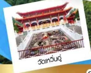
วัดเหวินอู่