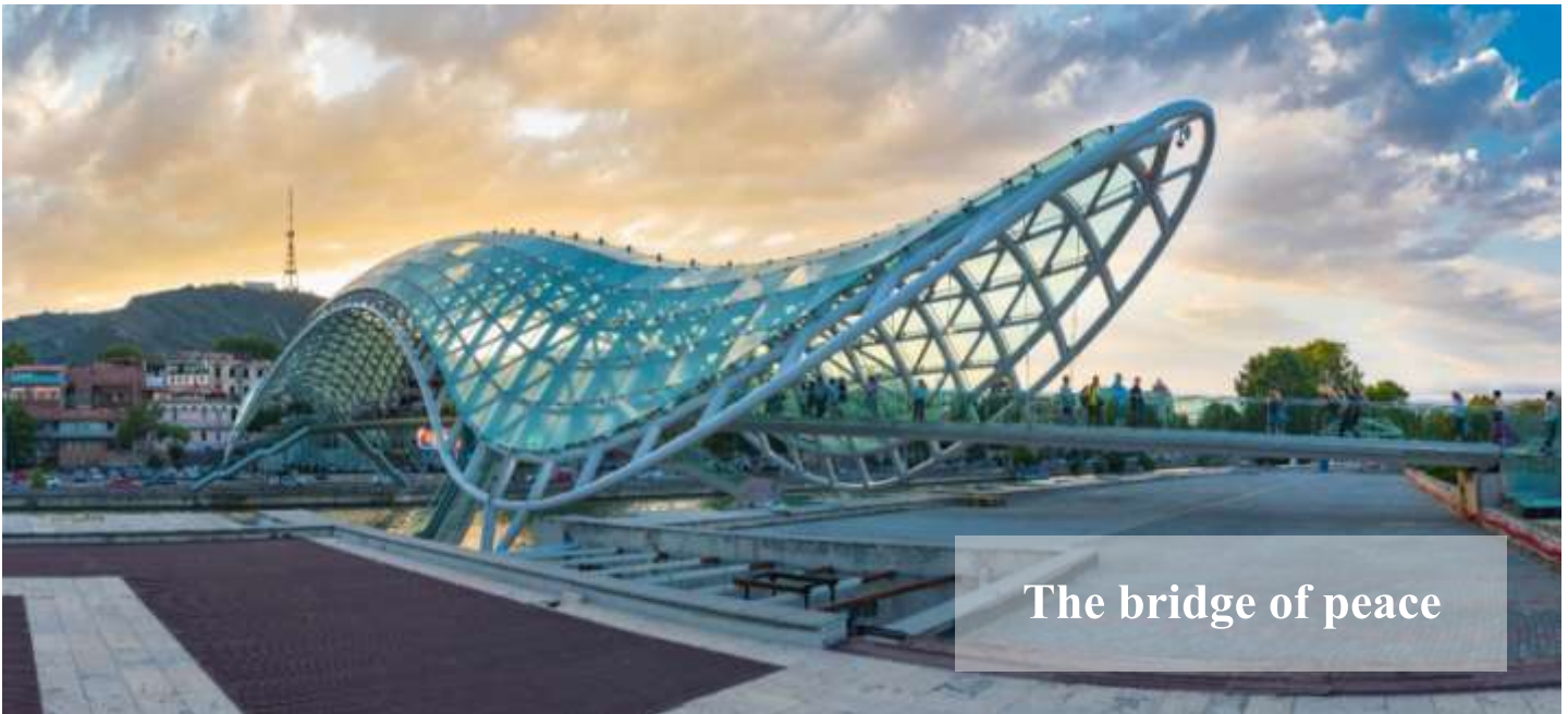
The bridge of peace

อิสระให้ท่านเดินเล่นชมเมืองทบิลีซี หรือ เดินเล่นช้อปปิ้งที่ Galleria Mall ศูนย์การค้าใจกลางกรุงทบิลีซีที่เต็มไปด้วยร้านค้าร้านอาหารคาเฟ่ และสินค้าแบรนด์เนมหลากหลายแบรนด์